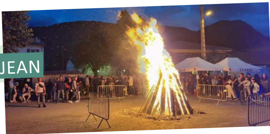
FÊTE DE LA SAINT-JEAN