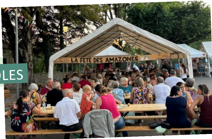
REPAS DES BÉNÉVOLES